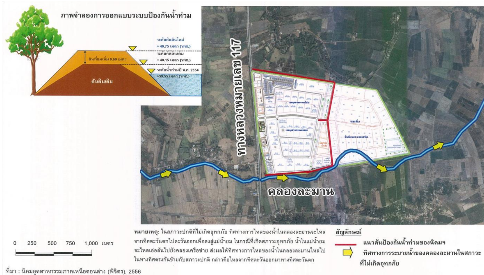
รูปที่ 1.3-3 ระบบป้องกันน้ำท่วมโดยรอบโครงการ